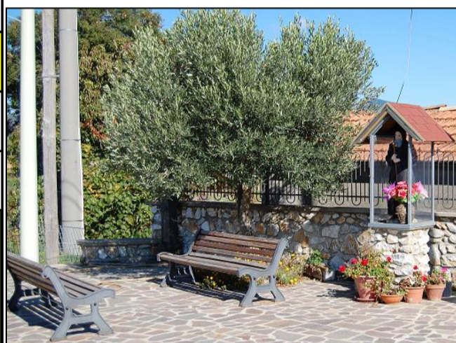
Scorcio della piazzetta con tabernacolo trasparente dedicato a San Francesco di Paola ubicata nel primo decennio del 2000 ad un lato del Quadrivio "Salvatore Panza"