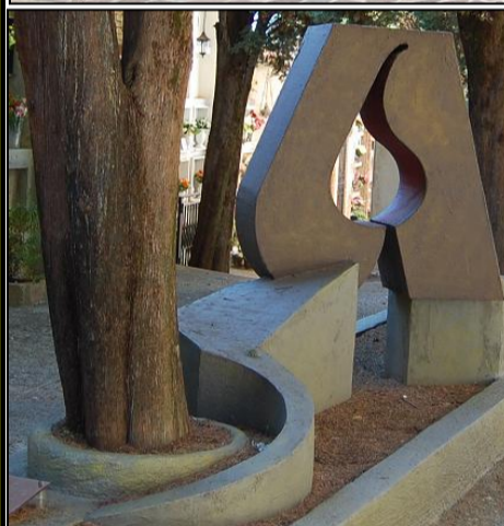
AVIS Struttura riprodotte un'imponente "A" stilizzata, con goccia di sangue incavata all'interno, collocata dall'AVIS Comunale San Pietro in Guarano - Lappano "Pasqualino Urso" nel Cimitero di San Pietro nel 2007 "A PERENNE RICORDO DEI DONATORI DI SANGUE"