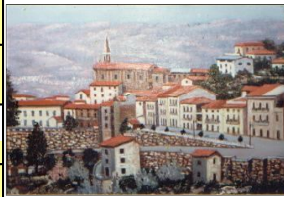
Francesco Urso - Olio su tela: