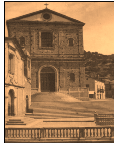
La "Nuova Chiesa"